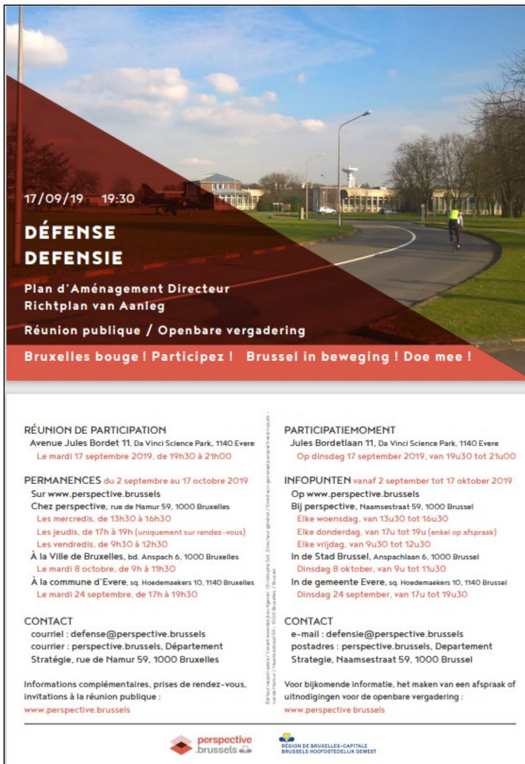
Figure : Toutes-boîtes