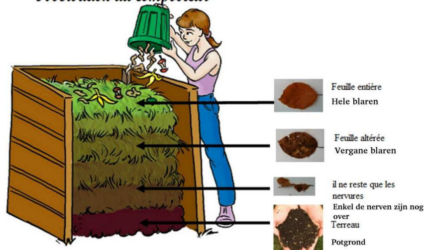
Observation du composteur

Netwerk Proper Kuregem kan u helpen om in uw wijk te composteren