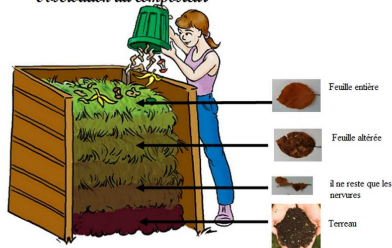
Observation du composteur

Le réseau Curreghem propre peut vous aider à composter dans votre quartier